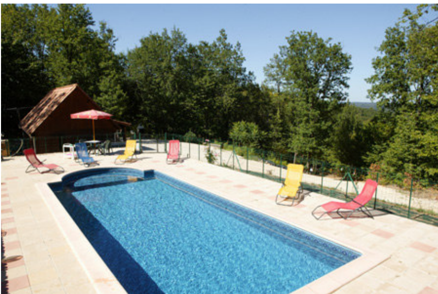
Piscine Privé 9x4